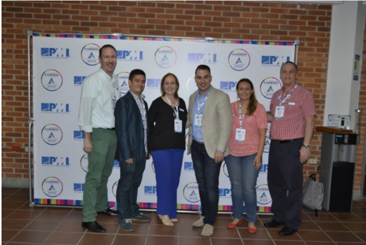
Junta Directiva Capítulo PMI Antioquia

El pasado 25 y 26 de agosto se llevó a cabo nuestro evento insignia de 2017 denominado “II Congreso Internacional de Dirección Estratégica de Proyectos”, con la participación de 214 asistentes. Fue un fin de semana de aprendizaje, experiencias y conexión para extender nuestros lazos profesionales con la comunidad de Gerencia de Proyectos de Antioquia y la Región.