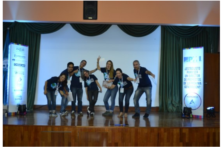
Reconocimiento Equipo de Voluntarios

Agradecimientos: El Capítulo PMI® Antioquia y toda la Comunidad de Gestión de Proyectos de la región agradece a los patrocinadores del evento: Universidad EIA, Compañía de Consultores S.A.S, Restrepo y Uribe S.A.S, Choucair, Practical Thinking, Personal Soft, Domuz Consultoría, Saurux, Hoteles Affinity Novelty y Corporación Universitaria Americana. Así mismo, los periódicos El Colombiano y El Tiempo.