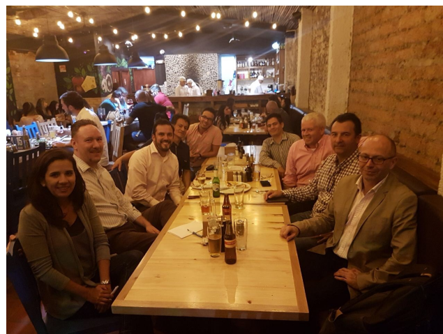
Tertulia Pedagógica - Pizzería Olivia

Las PDUs del evento fueron cargadas automáticamente a aquellos asistentes que son miembros del Capítulo PMI Antioquia y quienes se registraron con su membresía del PMI.