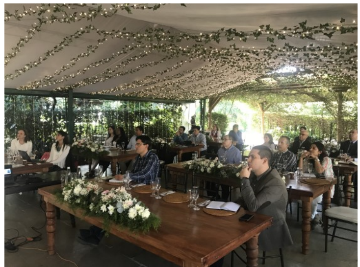
Representantes de las Universidades, PMI Internacional y el Capítulo PMI Antioquia