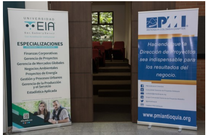
Aliado Educativo - Universidad EIA