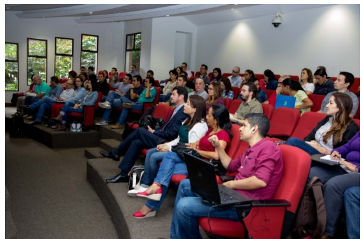
Comunidad Gerencia de Proyectos Antioquia

(PMIANT000024) III Jornadas de Gerencia de Proyectos: bajo este código quedó registrado el evento “III Jornadas de Gerencia de Proyectos” del Capítulo PMI Antioquia. Las PDU’s de los miembros del Capítulo fueron cargadas automáticamente como un servicio agregado. Cualquier inconveniente que tengan pueden canalizarlo con nuestro VP de Educación y Desarrollo.