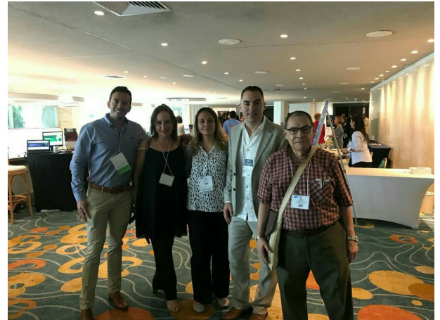
Líderes Capítulo PMI® Antioquia