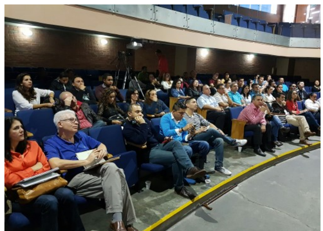
Comunidad Gerencia de Proyectos Antioquia

(PMIANT000023) Segundas Jornadas de Gerencia de Proyectos: bajo este código quedó registrado el evento “Segundas Jornadas de Gerencia de Proyectos” del Capítulo PMI Antioquia. Las PDU’s de los miembros del Capítulo serán cargadas automáticamente como un servicio agregado. Cualquier inconveniente que tengan pueden canalizarlo con nuestro VP de Educación y Desarrollo.