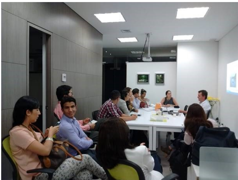
Sesión Grupo de Interés Gerencia de Proyectos de Innovación