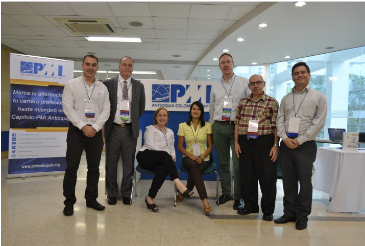
Junta Directiva Capítulo PMI Antioquia

El pasado 26 de agosto se llevó a cabo nuestro gran evento del 2016 denominado “De la Teoría a la Práctica: Seminario Taller de Habilidades Gerenciales” , con la participación de 120 asistentes. Fue una jornada de aprendizaje, intercambio de vivencias y experiencias, y networking para extender nuestros lazos profesionales con la comunidad de Gerencia de Proyectos.