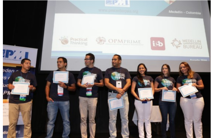
Reconocimiento Equipo de Voluntarios